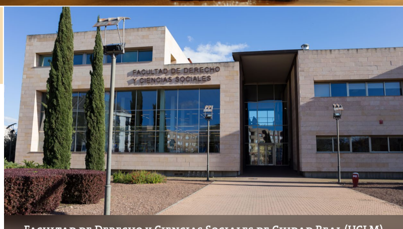
FACULTAD DE DERECHO Y CIENCIAS SOCIALES DE CIUDAD REAL (UCLM)

Dirigida a TODOS los profesionales del Derecho del Trabajo y Seguridad Social; Recursos Humanos; Estudiantes de la UCLM, con especial interés para los matriculados en algún curso del Grado en Relaciones Laborales y Desarrollo de Recursos Humanos; así como egresados en esta titulación.